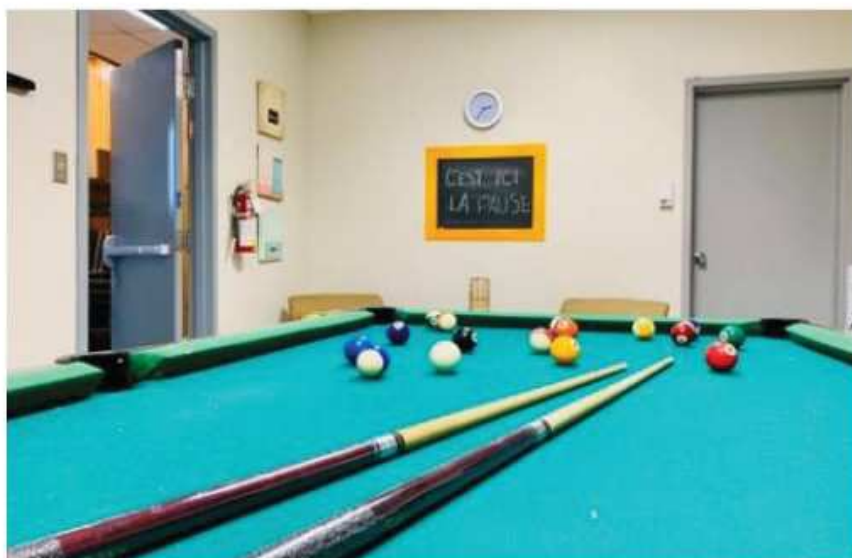
Centre communautaire – 286 rue de la Falaise